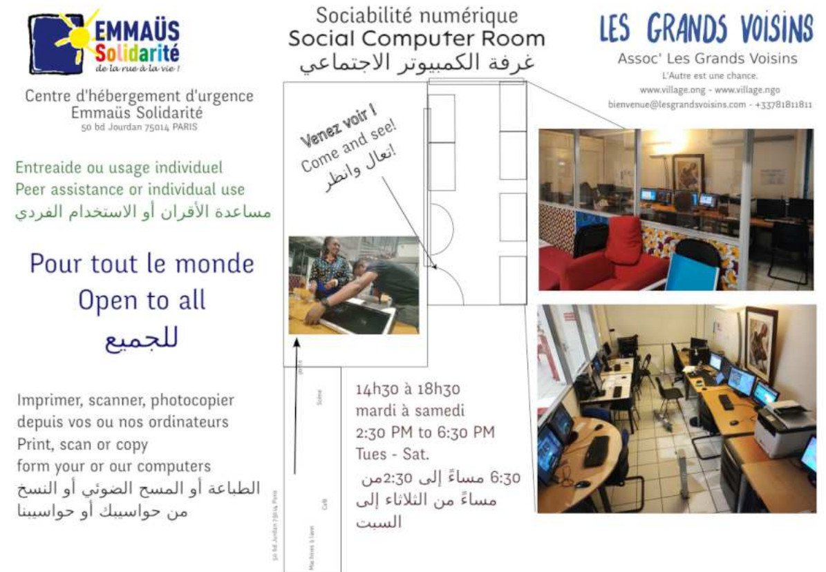
F b e 1- Ab p Em a b Sol d arité

S misè p lae ap is p è s d'u an. Ab x et m i-même avi p la è r é u is cob tives ave d t avab s c am d'Em a b . Un arp l d ard, u d s p at c patm 'aa c b é pm d re q 'l é taitu j s is crit au Co g Jean-Mo l n ave s è tatio . Ne avia j q 'à 2 enfab ac uè s p ar ja .