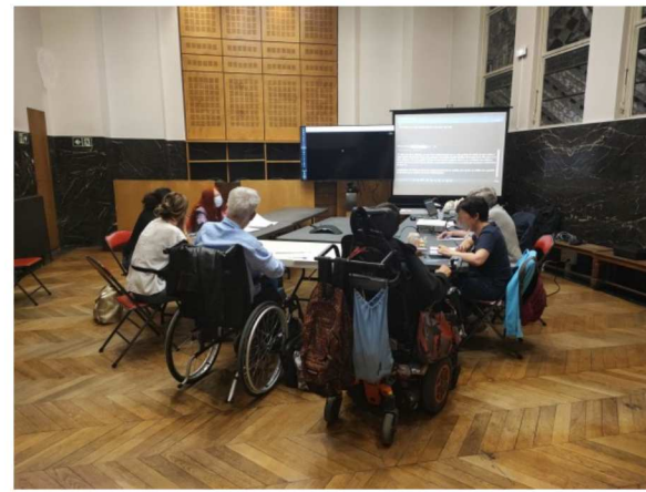
FIGURE 3 – Expérimentation pour CLH-Paris14