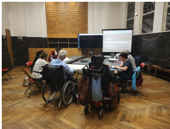
FIGURE 3 – Expérimentation pour CLH - Paris14