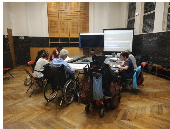
FIGURE 3 – Expérimentation pour CLH-Paris14