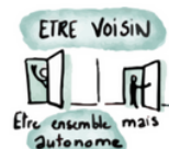
Figure 1 – Affiche pour Emmaüs Solidarité

Par ailleurs, le lundi de 17h à 21h se tient un atelier d'entraide numérique à l'Atelier de la Ressourcerie Créative au 93 ave. du Gén. Leclerc A l'intérieur du centre commercial 7 e boutique sur la gauche